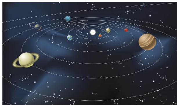
Atom (i detta fall en kalciumatom) Vårt solsystem

Denna modell pekar på att det vi har i vårt inre i motsvarande grad speglas i vårt yttre/ vår omvärld.